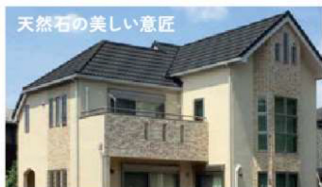
天然石の美しい匠匠

※メンテナンスコスト、メンテナンススケジュールは建築物の立地（地域・環境条件）や、使用条件により劣化速度が異なりますので、メンテナンス時期も様ではありません。このメンテナンススケジュールは、あくまで目安としてメンテナンス計画にご活用ください。